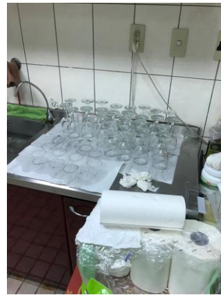
尾牙的杯子，洗過再擦過。