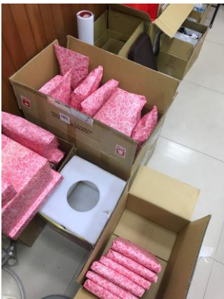
包裝尾牙用的抽獎禮品。