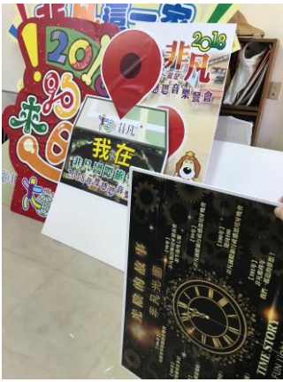
放在尾牙現場的珍珠板， 供客人拍照留作紀念。