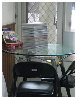
佈置公司的美勞作品。