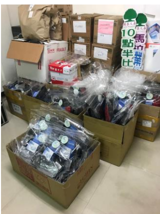
包裝給客人出團用的禮品。