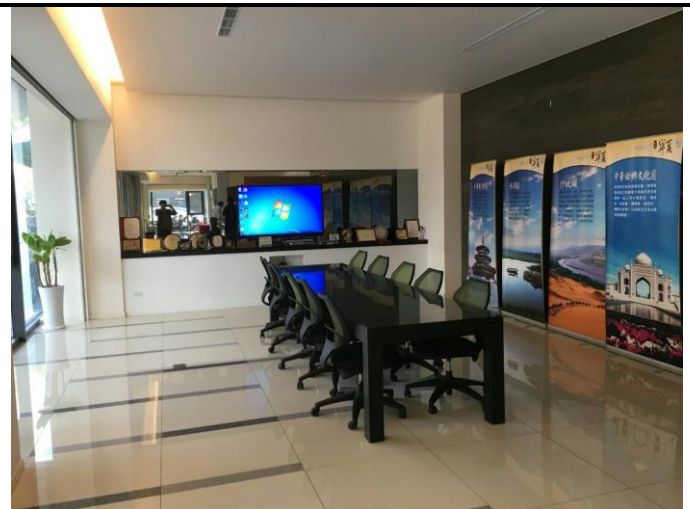
開會或接客的地方