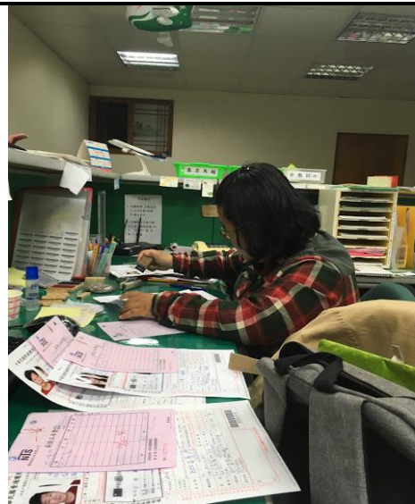
收完件回公司整理