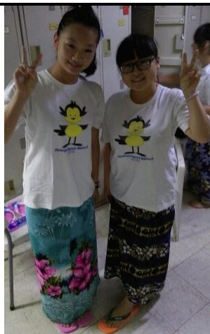
同事換迎賓的服裝